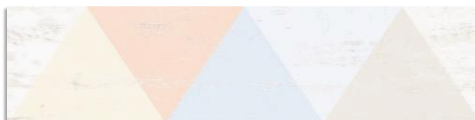
(3) Caria-R Blanco G.169