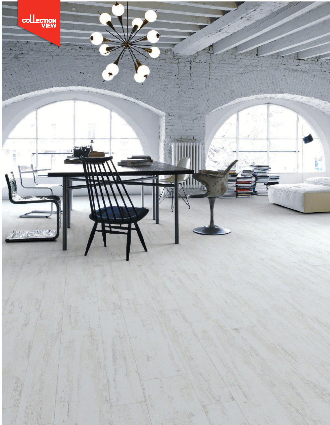
Efeso-R Blanco - 14,4x89,3 cm. / 21,8x89,3 cm.