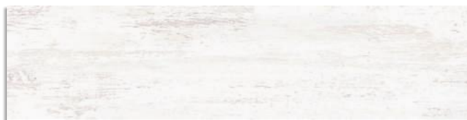
Efeso-R Blanco G.169