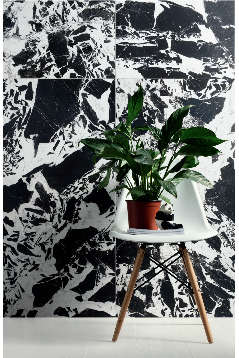
WALL SUPREME 60X120 24"X48"